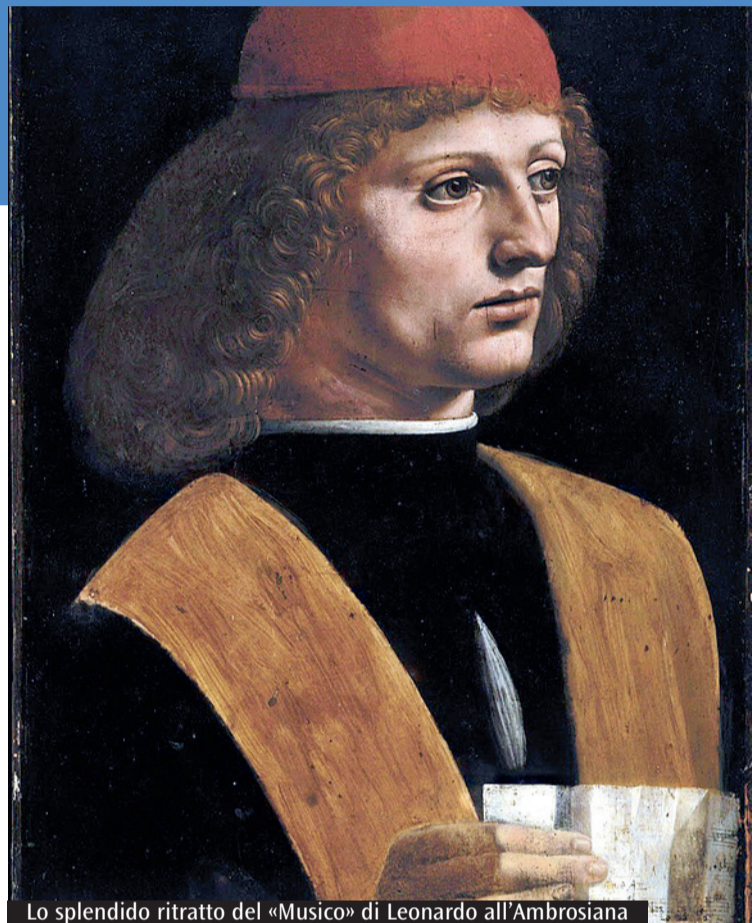
Lo splendido ritratto del «Musicista» di Leonardo all'Ambrosiana