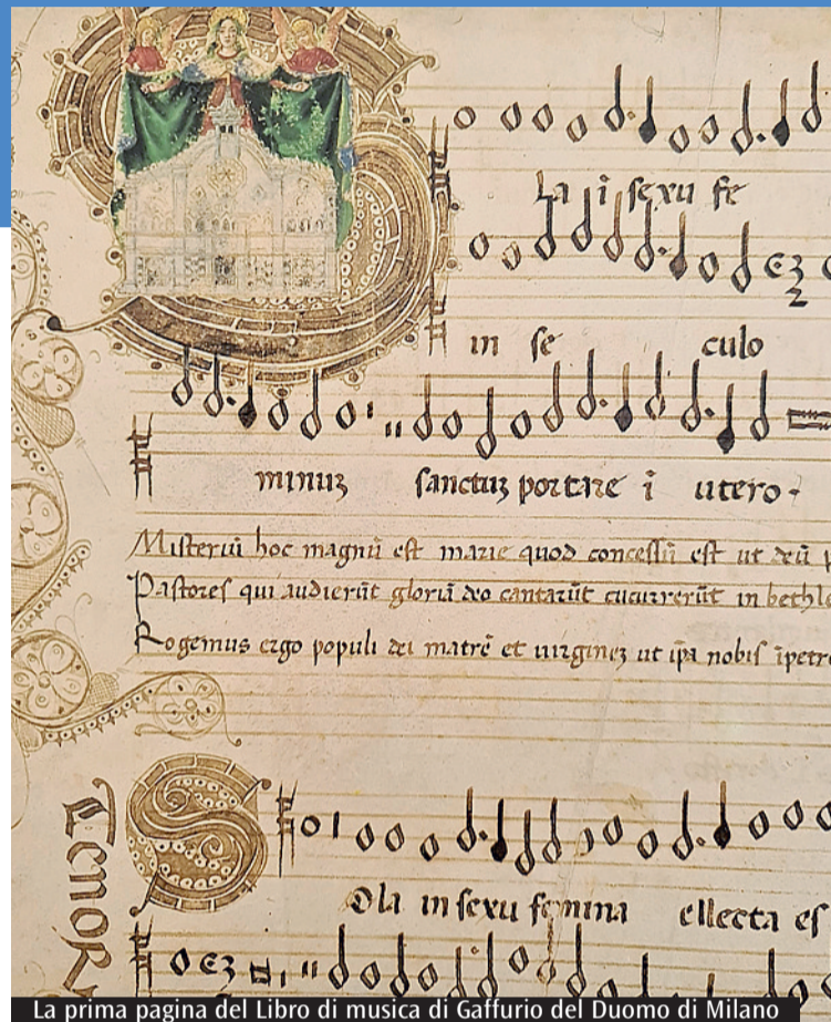
La prima pagina del Libro di musica di Gaffurio del Duomo di Milano