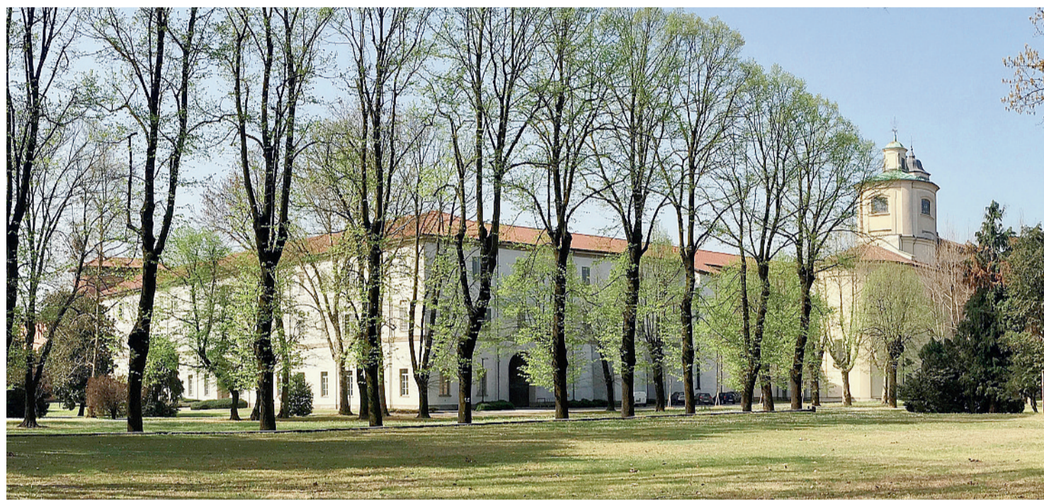
Il Centro pastorale ambrosiano di Seveso visto dal parco interno

Si terrà al Centro pastorale di Seveso dal 22 agosto al 3 settembre la settimana rivolta ai presbiteri che cambiano destinazione Meditazioni di don Ferruccio Ceragioli