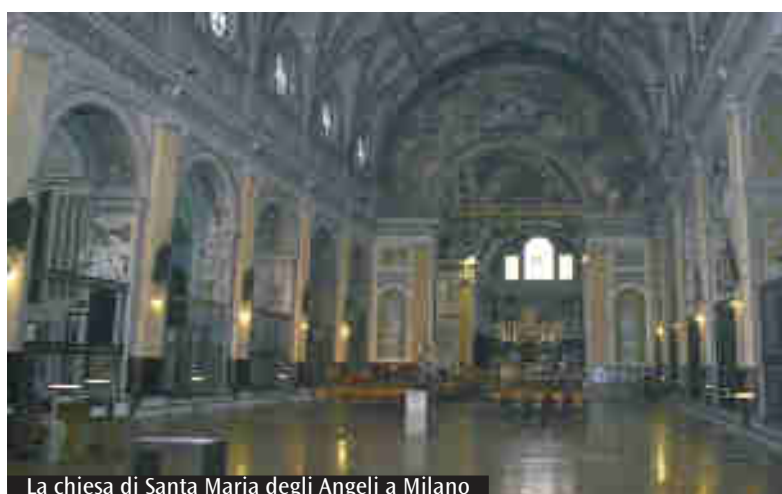
La chiesa di Santa Maria degli Angeli a Milano