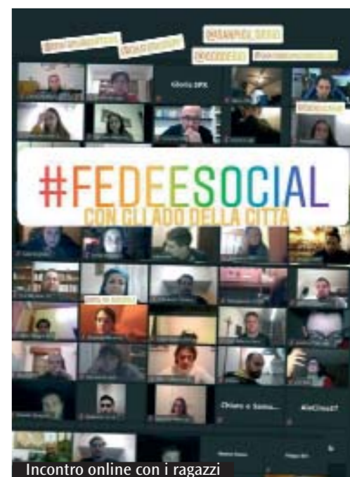
Incontro online con i ragazzi

* collaboratore Ufficio comunicazioni sociali