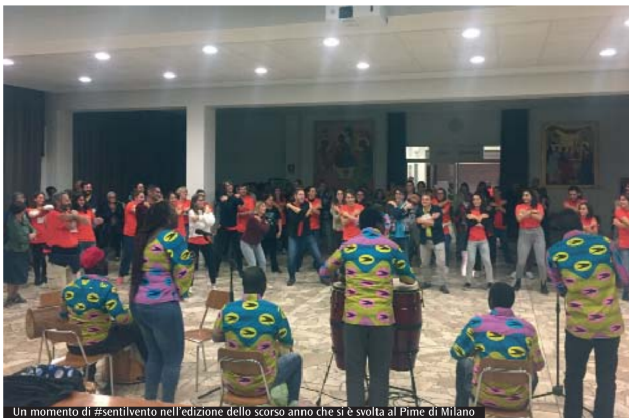
Un momento di #sentilvento nell'edizione dello scorso anno che si è svolta al Pime di Milano

copto-ortodosso e cristiano cattolico. E anche nei gruppi, i giovani racconteranno la propria personale esperienza della pandemia attraverso la prospettiva del proprio credo religioso».