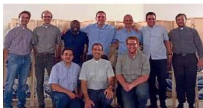
Qui sopra, il tableau con l'immagine tratta da un mosaico di Rupnik, il motto e le date delle ordinazioni, diaconale il 26 settembre e presbiterale il 12 giugno. Sotto, i dieci candidati in una foto di gruppo