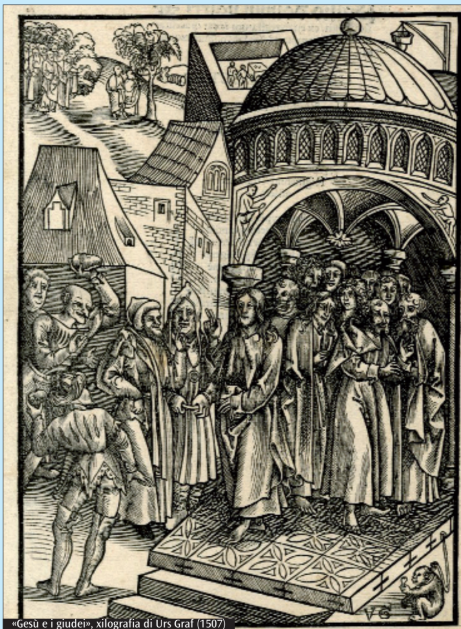
«Gesù e i giudei», xilografia di Urs Graf (1507)