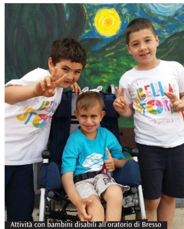
Attività con bambini disabili all'oratorio di Bresso

venuti spesso a Bresso a guardare le attività per poi portarle nei loro oratori. Cene, eventi, raccolte fondi, sono diverse le modalità che permettono di finanziare queste iniziative. «I ragazzi con disabilità pagano quello che pagano gli altri. Perché questo sia possibile, partecipiamo a diversi bandi dedicati al tema dell'inclusione e della disabilità e spesso vinciamo. L'ultimo in ordine di tempo è stato il concorso della Cei "Tutti per tutti", in cui abbiamo raggiunto l'ottavo posto e abbiamo vinto un premio di 3mila euro, provenienti dall'8x1000», racconta il sacerdote. E poi si organizzano momenti strettamente conviviali, in cui si raccolgono fondi per sostenere le attività di accompagnamento. «L'aspetto più bello di questa iniziativa è proprio che tutta la comunità se ne fa carico. Nessuno è lasciato da solo, tutti partecipano insieme», conclude don Carrozzo.