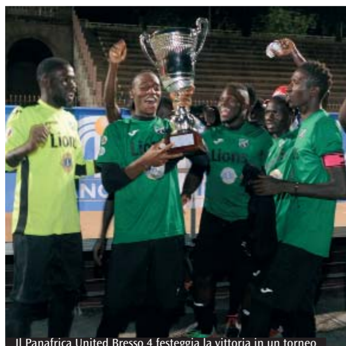
Il Panafrica United Bresso 4 festeggia la vittoria in un torneo