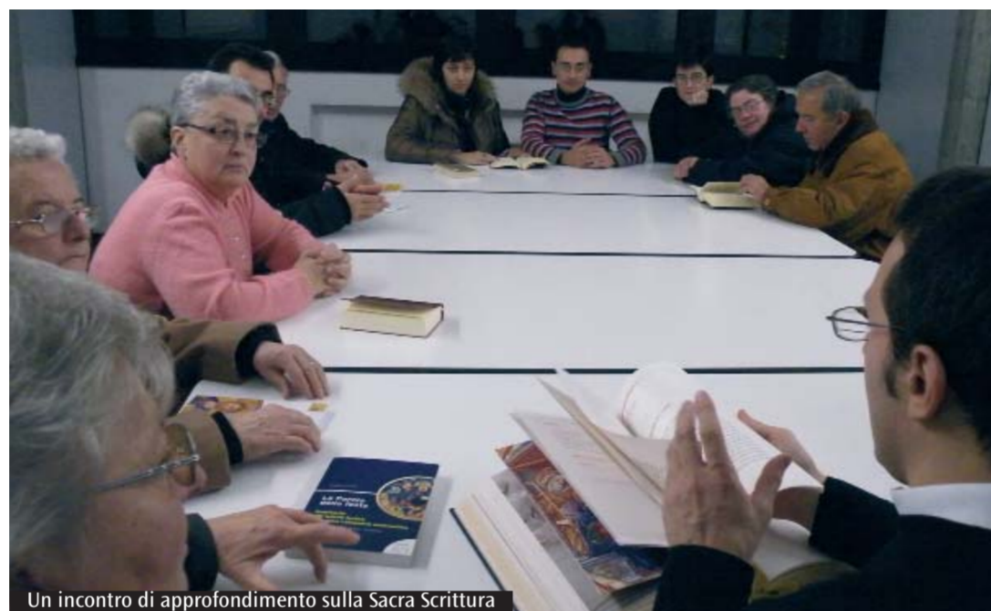
Un incontro di approfondimento sulla Sacra Scrittura

Bresso. Nella Comunità pastorale Madonna del Pilastrello, a livello di primo annuncio ed educazione alla fede, la Sacra Scrittura innerva gli itinerari di iniziazione cristiana, la pastorale giovanile e i percorsi verso il matrimonio cristiano, attraverso la lettura e l'ascolto del testo biblico e anche in occasione di incontri formativi e informativi, specialmente con le famiglie dei ragazzi. A livello di «formazione permanente», invece risulta significativa la presenza di Gruppi di ascolto che coinvolgono, giovani, adulti e anziani. Inoltre, durante l'anno momenti di lectio divina vengono offerti a tutti i fedeli, all'inizio dei tempi di Avvento e Quaresima, e durante l'anno a gruppi, associazioni, movimenti e ai partecipanti alle catechesi parrocchiali degli adulti. In questa Comunità pastorale un aspetto messo in grande rilievo dal discernimento del