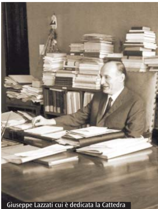
Giuseppe Lazzati cui è dedicata la Cattedra