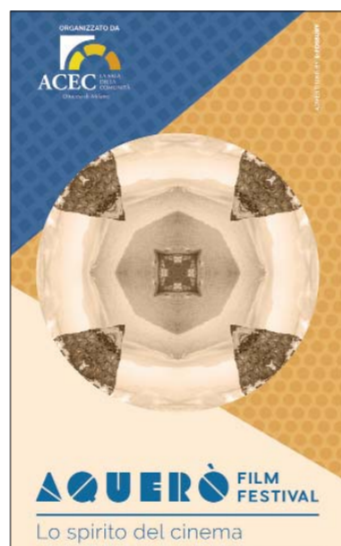
Sopra, il manifesto del Film festival Aquerò. A destra, la locandina di « Lourdes », campione di incassi in Francia