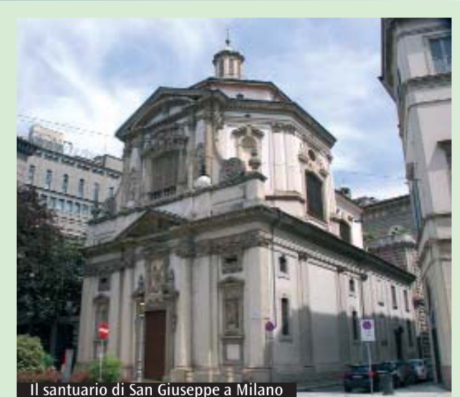
Il santuario di San Giuseppe a Milano