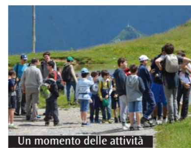
Un momento delle attività