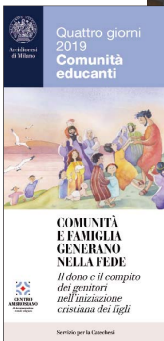
La locandina dell'iniziativa e uno scorso incontro nella sede di Milano, il Salone Pio XII