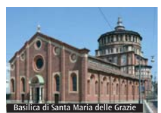
Basilica di Santa Maria delle Grazie