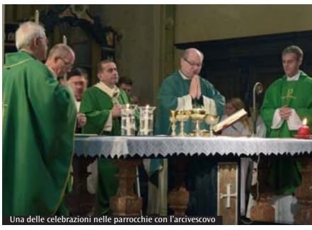
Una delle celebrazioni nelle parrocchie con l'arcivescovo

Nel Decanato di Trezzo sull'Adda prosegue la visita pastorale dell'arcivescovo. Dopo le celebrazioni e gli incontri con le Comunità pastorali San Gaetano da Thiene a Trezzo sull'Adda e Santa Maria della Rocchetta a Cornate d'Adda, l'Unità pastorale che comprende Basiglio e Masate, la parrocchia San Giovanni Evangelista di Busnago, e la giornata trascorsa con i sacerdoti del Decanato, in linea con il programma stabilito di visitare tutte le parrocchie, l'arcivescovo incontra oggi i fedeli dell'Unità pastorale che comprende Bettola di Pozzo d'Adda e Pozzo d'Adda: Alle ore 9, nella parrocchia