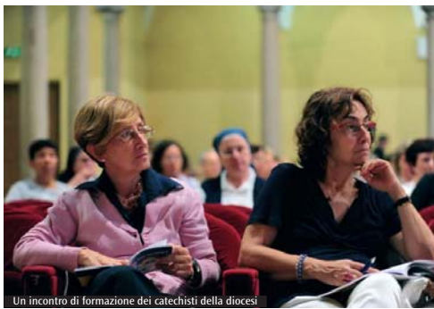
Un incontro di formazione dei catechisti della diocesi

seguire nessuna iniziativa di formazione alla luce del nuovo itinerario. Una seconda proposta di formazione, denominata «Percorso di approfondimento», è rivolta a catechisti che già hanno partecipato da tempo a iniziative di formazione secondo i nuovi itinerari. Questi percorsi di approfondimento hanno lo scopo di offrire un'ulteriore ripresa di quanto sperimentato negli anni scorsi con il metodo del laboratorio su argomenti inerenti il nuovo itinerario diocesano. Si promuovono nei Decanati questi percorsi per favorire la conoscenza e l'utilizzo dei nuovi sussidi mettendo a fuoco progressivamente i molteplici aspetti dell'itinerario e le dinamiche intrinseche al percorso, che si erano solo abbozzati con i laboratori dei primi quattro anni di formazione già proposti. È possibile conoscere in modo più dettagliato queste iniziative nel portale diocesano ( www.chiesadimilano.it ) nella home page del Servizio per la catechesi * responsabile del Servizio per la catechesi