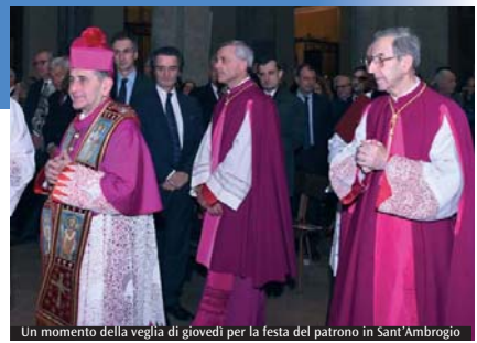
Un momento della veglia di giovedì per la festa del patrono in Sant'Ambrogio