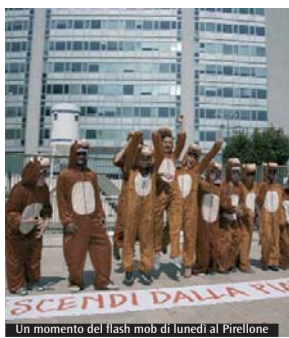
Un momento del flash mob di lunedì al Pirellone

to sarà assegnato come premio un viaggio per due persone in Kenya organizzato dall'agenzia di turismo responsabile «Viaggi e Migraggi». Per partecipare al contest occorre collegarsi al sito dedicato https://share.caritasambrosiana.it/scendi-dalla-pianta/ . «C'è una narrazione allarmistica del fenomeno migratorio. Con questo contest vogliamo invitare i cittadini a considerare l'incontro con lo straniero in modo diverso, un modo più aderente alla realtà quotidiana che tutti noi viviamo, ma che perdiamo di vista sopraffatti da una rappresentazione a senso unico. Tutti insieme dobbiamo ricostruire un nuovo senso comune. Non partendo dalla paura, che è sempre una cattiva consigliera, ma dal coraggio del nostro patrimonio di valori che è la nostra più autentica identità», ha spiegato monsignor Luca Bressan, vicario episcopale della Diocesi di Milano.