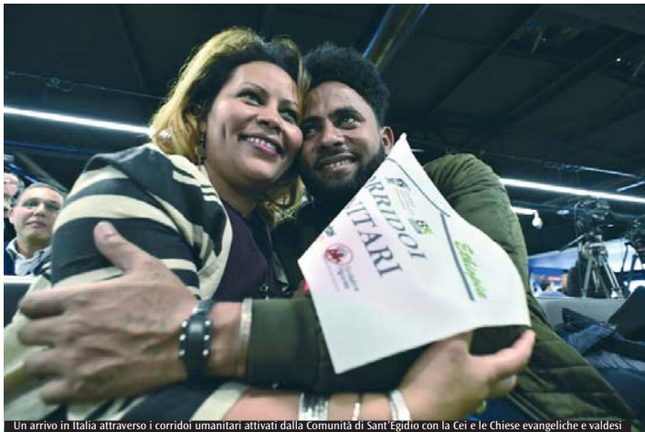
Un arrivo in Italia attraverso i corridoi umanitari attivati dalla Comunità di Sant'Egidio con la Cei e le Chiese evangeliche e valdesi