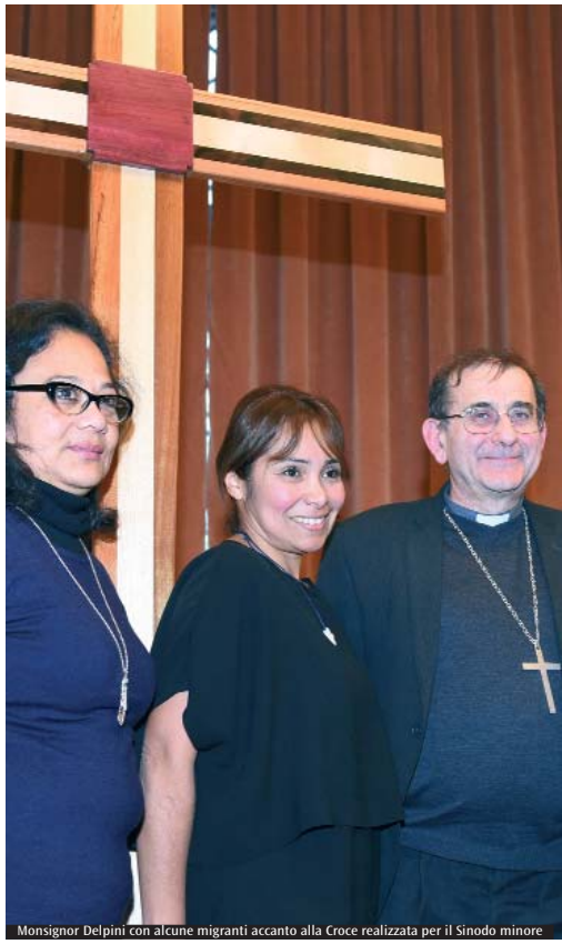
Monsignor Delpini con alcune migranti accanto alla Croce realizzata per il Sinodo minore