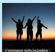
L'immagine nella locandina

L'Azione cattolica del Decanato di Gallarate organizza un ritiro spirituale di Avvento per il pomeriggio di sabato 25 novembre. L'incontro, dal titolo «Cittadini di Galilea. La gioia del Vangelo nella vita quotidiana», è libero e aperto a tutti e si svolge all'oratorio maschile di Lonate Pozzolo (via Papa Giovanni XXIII, 59) a partire dalle ore 14.45. La meditazione viene curata da monsignor Gianni Zappa, assistente unitario dell'Azione cattolica ambrosiana. Durante l'incontro è previsto un momento di silenzio per la riflessione personale e la condivisione nella fede. La conclusione dell'incontro è prevista per le ore 17. Per maggiori dettagli, scrivere una e-mail a segreteria@azionecattolicamilano.it o consultare il sito www.azionecattolicamilano.it o (M.V.)