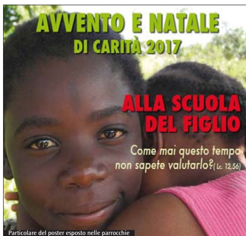
Particolare del poster esposto nelle parrocchie