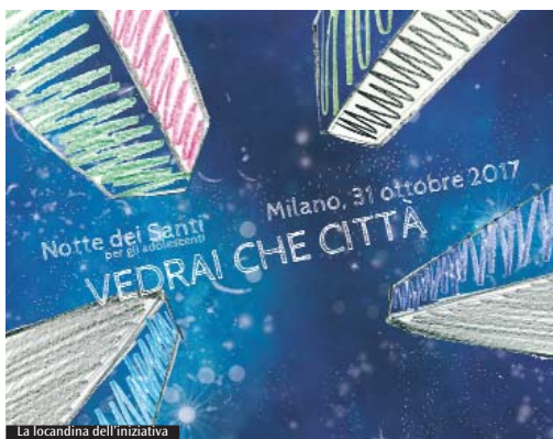
La locandina dell'iniziativa