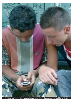
I ragazzi trascorrono molto tempo nelle chat