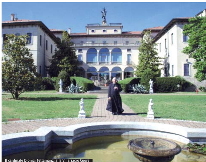
Il cardinale Dionigi Tettamanzi alla Villa Sacro Cuore