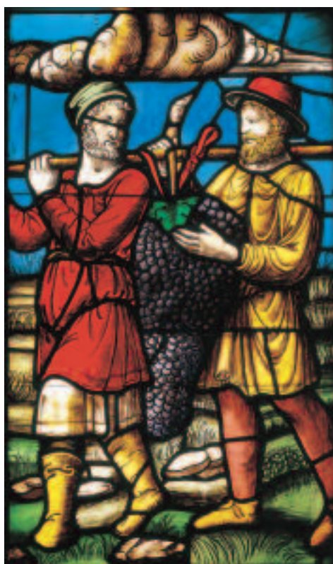
Duomo di Milano, I frutti della terra di Canaan (vetrata del XV sec.)