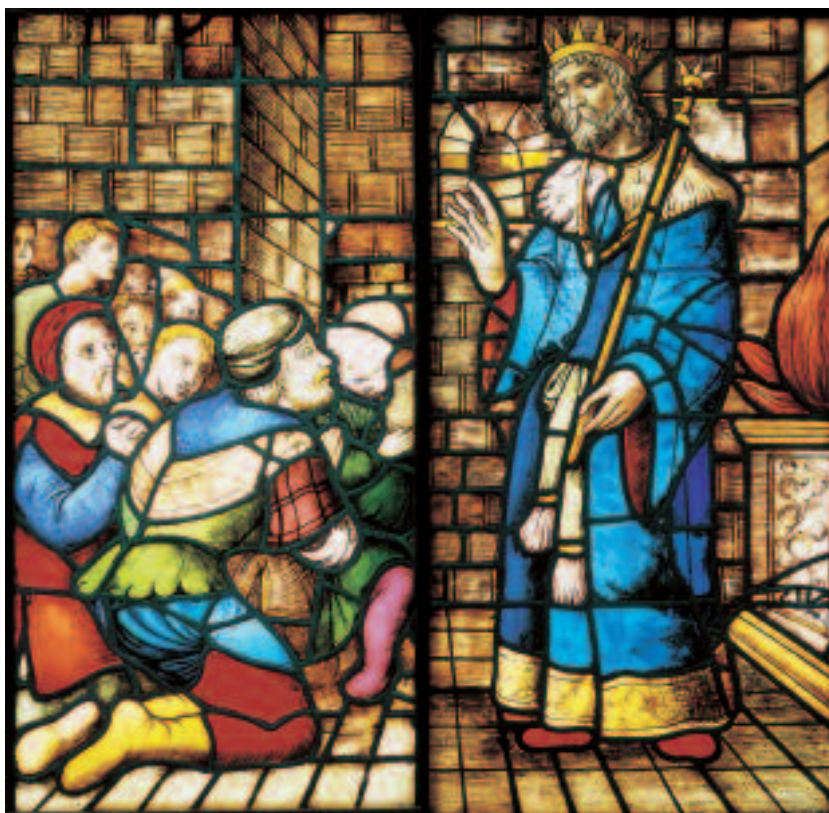
Duomo di Milano, Giuseppe si fa riconoscere dai fratelli (vetrata del XV sec.)

Prendendo spunto dalla volontaria sobrietà alimentare, la pratica penitenziale del digiuno si può opportunamente estendere ad altre forme di rinuncia volontaria (all'acquisto e al consumo di beni superflui, all'uso invasivo della televisione o di internet , alla chiacchiera telefonica...) che intercettano da vicino gli odierni stili di vita. Trovano così nuova applicazione le parole rivolte a Dio nel prefazio del giovedì della prima settimana di Quaresima: « Le nostre rinunce, trasformate in sostegno dei poveri, ci consentono di imitare la tua provvidenza ». Il digiuno non è dunque fine a se stesso, ma è una condizione necessaria per aprirsi ad altro, per fare spazio, come avvenne per Gesù, a "un altro cibo". Lo dice bene il prefazio del martedì della prima settimana di Quaresima: « Così (Gesù) ci ha insegnato a preferire agli alimenti terreni il