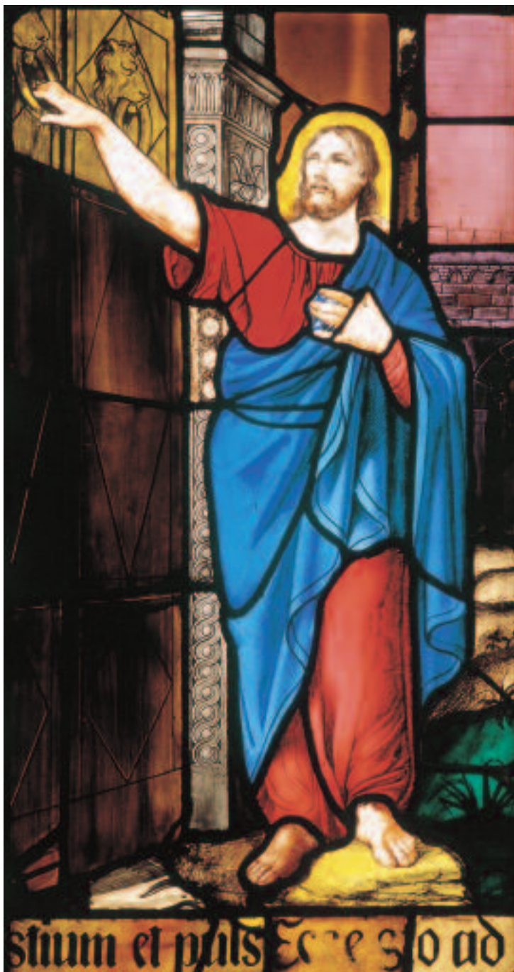
Duomo di Milano, «Ecco sto alla porta e busso» (vetrata dell'Apocalisse, XIX sec., part.)

Quello dei Dialoghi di Quaresima è, per ormai consolidata consuetudine, un itinerario