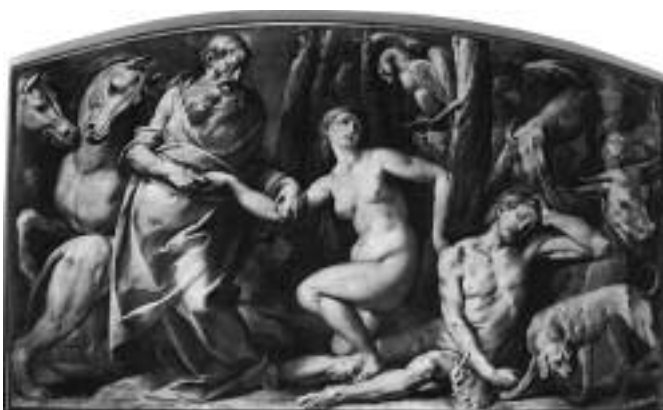
Museo del Duomo di Milano, Giovanni Battista Crespi, la creazione di Eva (disegno preparatorio per l'altorilievo della facciata, XVII sec.)

I monocromi sono bellissimi: le figure sono compresse in stretti spazi che ne esaltano le forme e i volumi. In particolare, le figure femminili nella loro compostezza e nella loro concreta fisicità esaltano l'eroismo di queste donne, pronte al sacrificio per la salvezza del proprio popolo: la Regina di Saba si inchina, timorosa ed ammirata, davanti al nobile Salomone, in abiti da guerriero ma con la corona sulla testa in modo ben evidente. Ester, sorretta da due ancelle, davanti alla maestà di Assuero è colta da vertigine: il volto è delicato, dolce, la