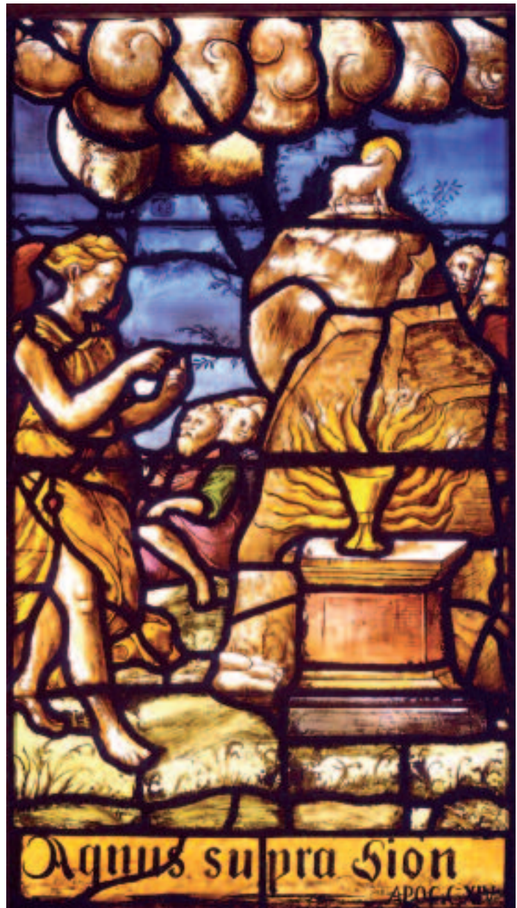
Duomo di Milano, «Agnus supra Sion» (vetrata dell' Apocalisse , XV sec., part.)

La sfida dei Dialoghi di Quaresima di quest'anno è quindi il tentativo di "tradurre" questo messaggio, che è poi la buona notizia di sempre, in un linguaggio comprensibile agli uomini di oggi, poco avvezzi a districarsi tra parole tecnicamente ineccepibili ma ormai pressoché fruste, quali "grazia", "salvezza", "redenzione", "peccato"... D'altra parte l'annuncio evangelico non può essere edulcorato, non può trasformarsi in parola avvolgente e generica, a meno di non voler rischiare l'irrelevanza teorica e pratica. Sotto questo profilo, il Mistero pasquale – cui predispone il Tempo di Quaresima – è uno strumento preziosissimo per tornare alla fonte del credere, per riandare alle radici della speranza, per ritrovare nel dono stesso di Cristo al Padre la ragione del nostro spendersi quotidiano.