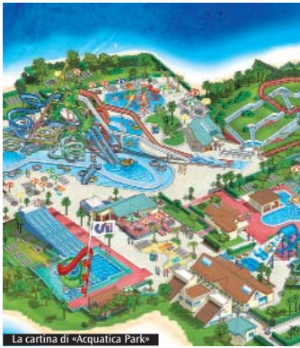
La cartina di «Acquatica Park»