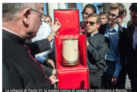
La reliquia di Paolo VI: la maglia intrisa di sangue che indossava a Manila