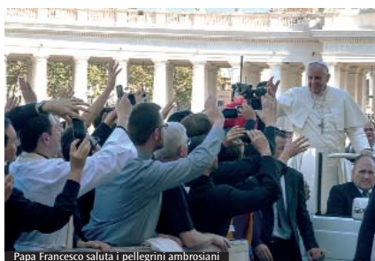
Papa Francesco saluta i pellegrini ambrosiani