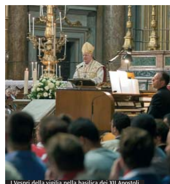
I Vespri della vigilia nella basilica dei XII Apostoli