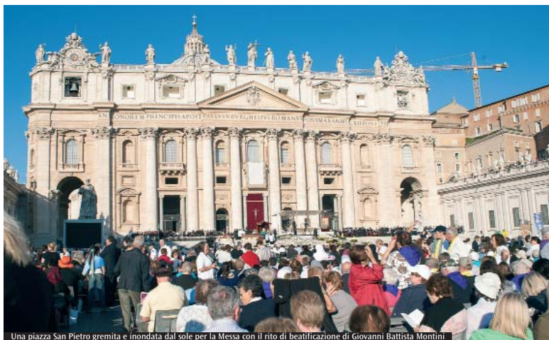
Una piazza San Pietro gremita e inondata dal sole per la Messa con il rito di beatificazione di Giovanni Battista Montini

Angelo Scola. La beatificazione di Montini un evento che «marcherà la storia»