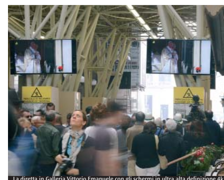
La diretta in Galleria Vittorio Emanuele con gli schermi in ultra alta definizione 4K