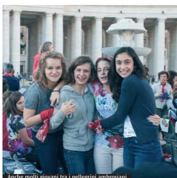
Anche molti giovani tra i pellegrini ambrosiani