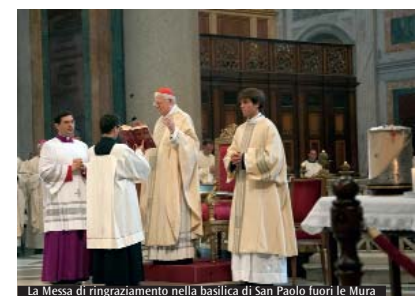
La Messa di ringraziamento nella basilica di San Paolo fuori le Mura