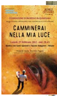
Sopra, la locandina e il tema della Celebrazione di ingresso in Quaresima per universitari e giovani di Milano. A destra, un momento di preghiera

Gesù che viene a far Pasqua con gli uomini e le donne di oggi. Nella tradizione della Chiesa il cammino dei quaranta giorni è caratterizzato da un rinnovato proposito di preghiera, di digiuno e di carità. In questo periodo ogni cristiano cerca tempi e occasioni per stare accanto a Gesù in maniera più profonda; così facendo può intuire qualcosa di più del cuore del Signore e penetrare più a fondo il mistero della Pasqua. E quindi necessario prepararsi a questo momento in modo adeguato, con un cammino che ci aiuti a ritrovare la gioia dell'incontro con Gesù morto e risorto e a consolidare le ragioni del nostro credere. Il nostro cuore ha bisogno di costruire alcune condizioni senza le quali è impossibile suscitare uno spirito di preghiera ed interrogarsi su chi sia un vero uomo spirituale.