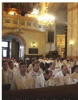
Una celebrazione nella chiesa di San Floriano