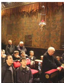
In preghiera nel Santuario di Czestochowa