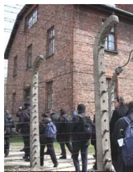
Visita al campo di Auschwitz-Birkenau