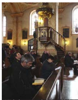
A Wadowice, paese natale di Giovanni Paolo II

Dal lunedì 16 a venerdì 20 aprile cento giovani sacerdoti ambrosiani hanno vissuto in Polonia il tradizionale pellegrinaggio a loro riservato, guidato dall'Arcivescovo di Milano, cardinale Angelo Scola. Tra gli altri era presente anche il Vicario generale, monsignor Carlo Redaelli. Il pellegrinaggio ha avuto al centro la figura di Giovanni Paolo II e i pellegrini hanno visitato alcuni luoghi significativi della vita del Papa beato, del suo ministero di sacerdote e di vescovo che lo hanno formato a essere il Papa che tutti abbiamo conosciuto. Nel corso del pellegrinaggio il cardinale Angelo Scola ha tenuto due meditazioni. Testi integrali, approfondimenti, video e photogallery sul pellegrinaggio sono pubblicati sul sito della Diocesi www.chiesadimilano.it .