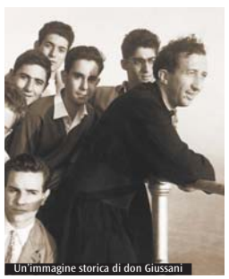
Un'immagine storica di don Giussani

Domani, alle ore 21, in Duomo, l'Arcivescovo, cardinale Angelo Scola, presiederà una celebrazione eucaristica in occasione del 10° anniversario della morte del Servo di Dio monsignor Luigi Giussani (22 febbraio 2005) e del 33° del riconoscimento pontificio della Fraternità di Comunione e liberazione (Cl) (diretta su Telenova2 - canale 664 del digitale terrestre - e su www.chiesadimilano.it). Ricorrenze che vengono ricordate con Sante Messe presiedute da cardinali e vescovi in centinaia di città in Italia e nel mondo. L'elenco delle celebrazioni, in continuo aggiornamento, è su www.clonline.org. Tra le tante, segnaliamo quella di Roma, domani sera, con il cardinale Agostino Vallini. È imminente anche l'udienza concessa il 7 marzo a tutto il movimento da papa Francesco che ha già avuto occasione di invitare Cl a «preservare la freschezza del carisma... rinnovando