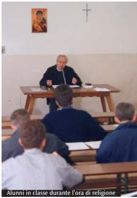
Alunni in classe durante l'ora di religione

nascita del fratellino e della sorellina», prosegue don Di Tolve. «Proprio questo è stato il tema della rappresentazione teatrale che abbiamo proposto agli insegnanti: "Nella pancia della mamma". Poi, in un secondo momento, si è svolta la parte biblica più specifica». Nei prossimi giorni invece prenderanno il via i laboratori divisi per territorio. Si affronteranno questioni molto concrete, come la festa della scuola e la preparazione del presepe. Per le primarie e secondarie di 1° e 2° grado, invece, si parte dalle nuove indicazioni di insegnamento della religione cattolica, pubblicate lo scorso anno dalla Cei e dal ministero dell'Istruzione. «Queste vengono trasferite nel contesto culturale», riprende Di Tolve, «durante incontri che hanno per tema il senso della vita, il mistero cristiano, la libertà religiosa e il dialogo oggi tra le culture e le religioni». Il programma (consultabile sul portale) è molto vario. Per esempio, sulla questione degli adolescenti è stata proposta una riflessione in merito a che cosa vuol dire vivere questa età nell'era digitale.