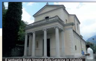
Il santuario Beata Vergine della Caravina in Valsolda