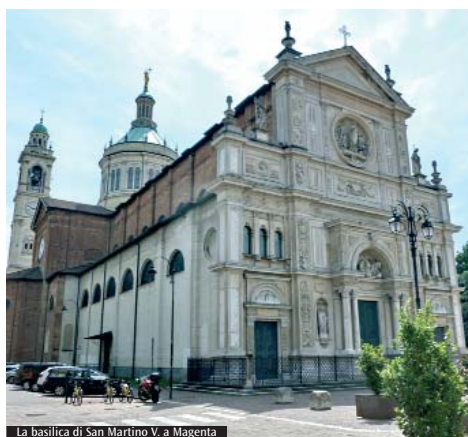
La basilica di San Martino V. a Magenta