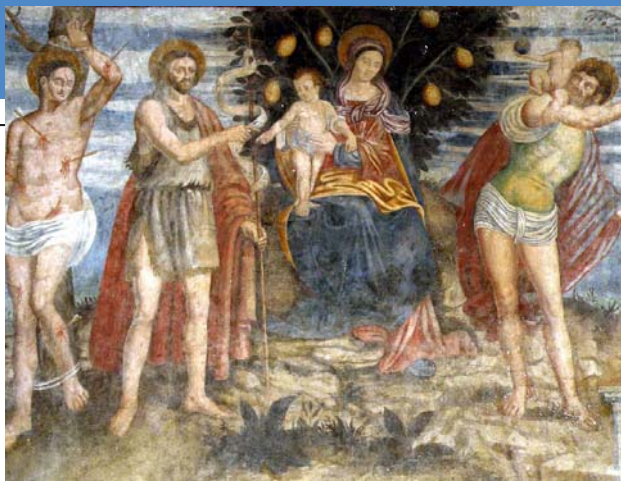
La «Madonna dei limoni» e uno scorcio del presbitero con gli affreschi del '700 oggi in corso di restauro. Sotto, l'abbazia di san Donato