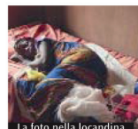
La foto nella locandina

qualità dei servizi di salute neonatale e materno-infantili rafforzando la gestione dei servizi sanitari, migliorando l'assistenza al parto, formando lo staff sanitario locale e potenziando il sistema di riferimento delle emergenze all'ospedale. Ad esso si è purtroppo affiancata la più grave epidemia di Ebola che abbia mai colpito la popolazione dell'Africa occidentale e che rende l'intervento degli operatori del «Cuamm» lì presenti ancor più cruciale e complesso. Da Lecco e provincia sono ormai un discreto numero di medici chiamati per svolgere un periodo di servizio in campo sanitario in Africa. In questi anni si sono periodicamente ritrovati, sia in occasione di incontri per volontari rientrati, sia per loro conto a Lecco, conservando il desiderio di continuare a sostenere il «Cuamm» e il suo impegno per l'Africa.