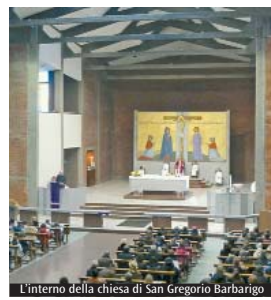
L'interno della chiesa di San Gregorio Barbarigo