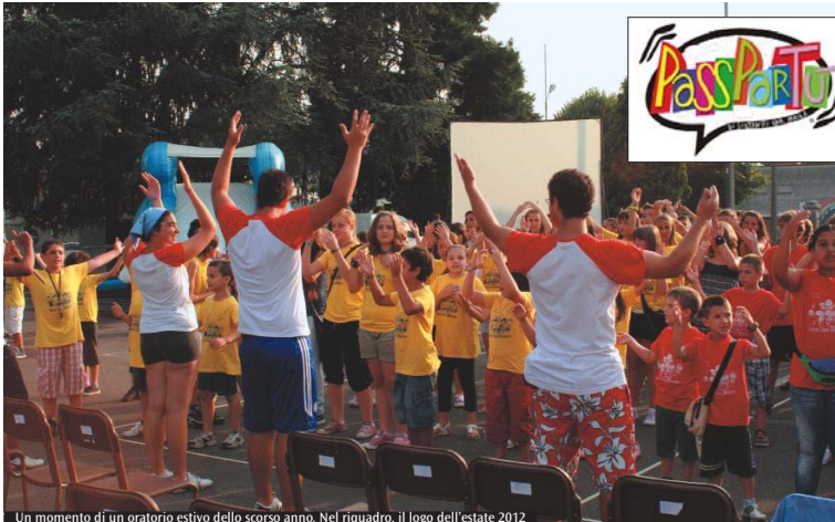
Un momento di un oratorio estivo dello scorso anno. Nel riquadro, il logo dell'estate 2012