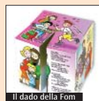
Il dado della Fom

mezza giornata, e raccoglie diverse tematiche: storia di Milano, Duomo e dintorni, arte, tesori ambrosiani, spiritualità, parchi e musei... All'interno anche cartine e indicazioni per raggiungere il luogo di incontro con il Papa. «Star Light» (2,50 euro) invece è una magica lampada da accendere su tutte le finestre delle case per illuminare la notte della vigilia del 2 giugno con Benedetto XVI in occasione del VII Incontro mondiale.