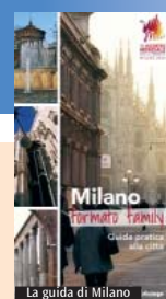
La guida di Milano

potrebbe animare il cammino con brevi spettacoli, concerti o momenti di animazione. Artisti di strada potrebbero mettersi a disposizione di bambini, mentre per chi ha qualche anno in più si potrebbero prevedere zone di sosta e ristoro. Ovviamente lungo il percorso non mancheranno aree attrezzate promosse dalla Fondazione che metterà a disposizione acqua, servizi, accoglienza di base. «Vorremmo che tutti partecipassero in maniera attiva all'Incontro e l'ultimo miglio è una bella opportunità per essere protagonisti», conclude don Bruno.