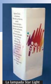
La lampada Star Light