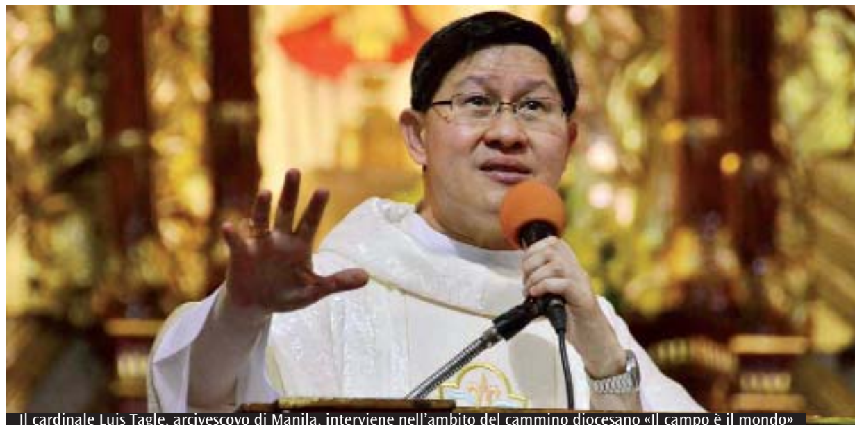
Il cardinale Luis Tagle, arcivescovo di Manila, interviene nell'ambito del cammino diocesano «Il campo è il mondo»

Quale il ruolo degli ordini religiosi, delle associazioni, gruppi e movimenti? Quale volto devono assumere oggi le parrocchie e quale immagine del popolo di Dio? Gli aspetti su cui riflettere sono tanti e tutti molto impegnativi: per questo, al termine della riflessione e dopo un breve stacco musicale, preti e diaconi potranno rivolgere al cardinale Tagle ulteriori domande a completamento del suo intervento. La sera del 26 febbraio, dalle 21 alle 22.45, sempre in Duomo, i temi verranno riproposti dall'Arcivescovo di Manila anche ai laici ambrosiani, ai membri dei consigli pastorali e a tutti i fedeli impegnati nelle diverse realtà ecclesiali. Anche a loro verrà presentata la Chiesa delle Filippine, mentre un intervistatore (che avrà ascoltato la riflessione del mattino) rivolgerà domande al Cardinale. Inutile dire quanto il confronto tra Chiesa, pur molto differenti, ma impegnate nell'evangelizzazione di grandi metropoli, sia davvero una ricchezza per entrambe. Non si può inoltre dimenticare la tragedia che