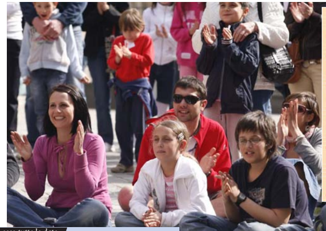
ecco tutte le date