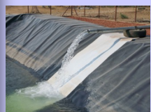
... vasca di decantazione