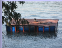
...pompa ad immersione per aspirazione acqua dallo Zambesi